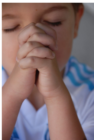
la prière, un acte de confiance

les Écritures viennent mettre en lumière le sens de nos existences ; la révélation de Dieu nous permet de discerner ses desseins au travers des circonstances individuelles ou collectives, au travers des événements heureux ou malheureux. N'oublions jamais que, si nous ne savons bien souvent répondre au mal que par le mal, telle n'est pas la manière d'agir de Dieu dans sa providence. Si, d'une manière incompréhensible, Dieu permet que le mal sévisse entre les hommes, c'est qu'il est capable, d'une manière qui échappe à notre intelligence, de changer le mal en bien.